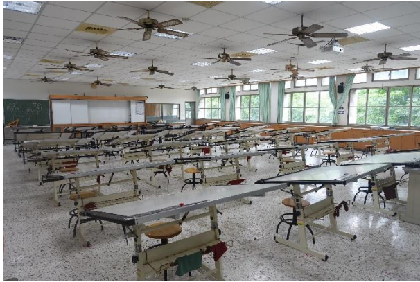
美工大樓 3 樓—設計圖法教室 3-3(AC0303)