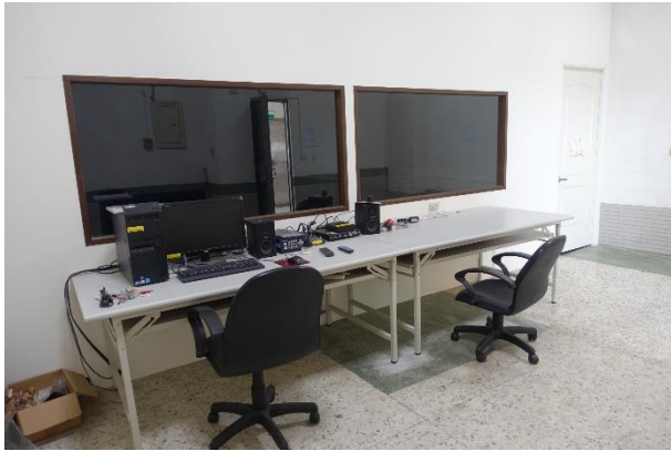
美工大樓 6 樓—數位攝影教室 6-3(AC0603)