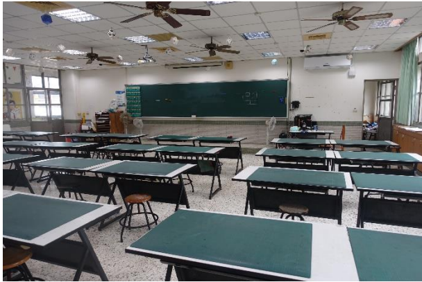
美工大樓 3 樓—設計教室 3-1(AC0301)