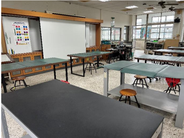
美工大樓 3 樓—設計教室 3-2(AC0302)