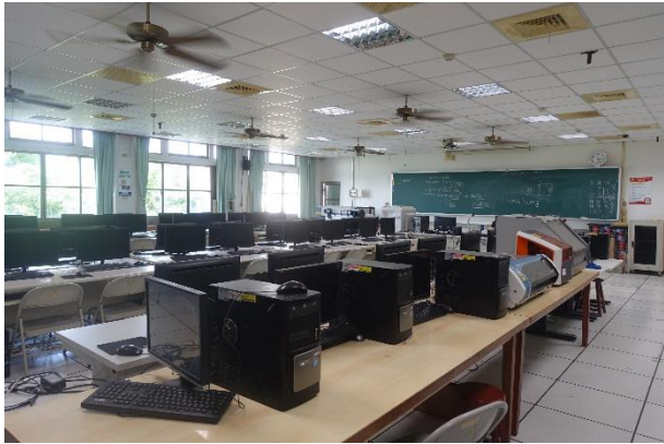
美工大樓 4 樓—電腦教室 4-3(AC0403)