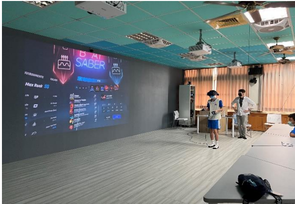
美工大樓 5 樓—多媒體情境教室 5-4(AC0504)