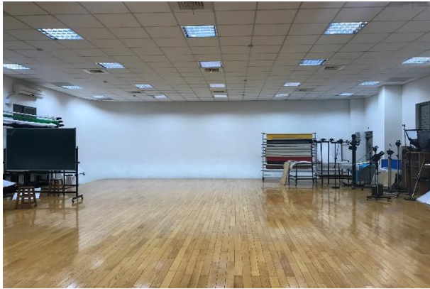
美工大樓 6 樓—攝影教室 6-1(AC0601)