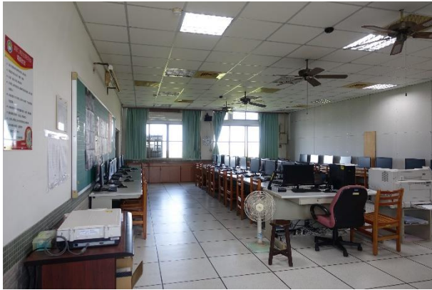
美工大樓 5 樓—數位設計教室 5-3(AC0503)